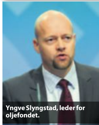
Yngve Slyngstad, leder for oljefondet.